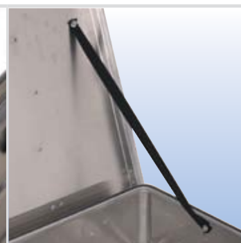
Pasek zabezp./Uszczelka gumowa