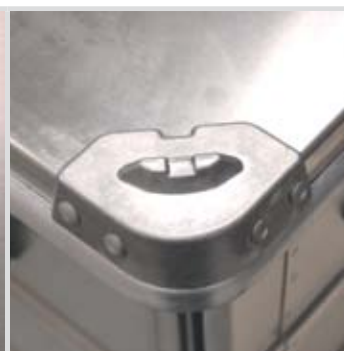
Narożnik aluminiowy do składowania piętrowego